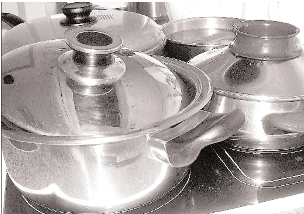
Nicht in allen Restaurationsbetrieben möchte man als Kunde wahrscheinlich in die Töpfe gucken.

Zudem müsste auch darüber nachgedacht werden, solche Ekelbetriebe öffentlich bekannt zu machen. Dies wäre für viele sicher ein Anreiz, in Sachen Hygiene nichts anbrennen zu lassen und würde gleichzeitig auch als eine Art Marketinginstrument dienen. Zudem würden Kunden viele unliebsame Erfahrungen, sprich Magenverstimmungen, erspart. Dass es fehlbare Betriebe gibt, die seit zwei Jahren nicht mehr kontrolliert wurden, stimmt nicht nur bedenklich, es ist schlicht und ergreifend eine Schande. Hier muss Abhilfe geschaffen werden und zwar sofort – zum Schutz des Konsumenten, aber auch zum Schutz der vielen Betriebe, die einwandfrei arbeiten. hab